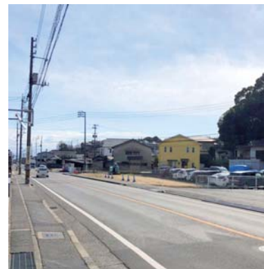
物件 北からの景観