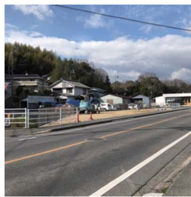
物件 南からの景観